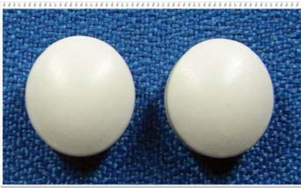
Aspirin (300) เม็ดกลมสีขาวเคลือบ ขนาด Ø1 cm.ผลิต/จำหน่ายโดยบริษัทไอสต อินเตอร์