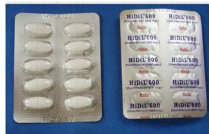
Gemfibrozil (600 mg/tab) เม็ดรีสีขาว ขนาด 1x2 cm. บรรจุในแผงบิสเตอร์ใส ผลิต/จำหน่ายโดยบริษัทเบอร์ลิน