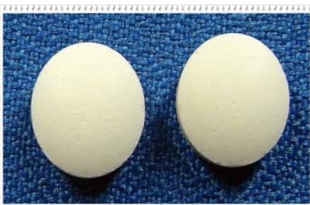
Sodamint (300) เม็ดกลมสีขาว ขนาด Ø 0.9 cm. ผลิต/จำหน่ายโดยบริษัท GOLDEN CUP PHARMACEUTICAL