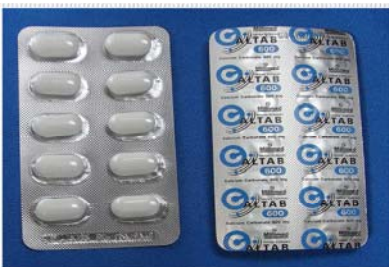
Calcium carbonate (600 mg/tab) เม็ดรีสีขาว ขนาด 0.8x1.5 cm บรรจุในแผงบิสเตอร์ใส ผลิต/จำหน่ายโดยบริษัทมิลลิเมด