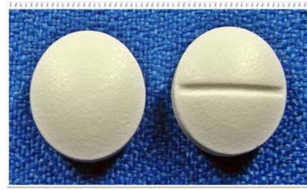
Chloroquin เม็ดกลมสีขาว มีเส้นแบ่งครึ่งเม็ดยา ขนาด Ø 1 cm ผลิต/จำหน่ายโดยองค์การเภสัชกรรม